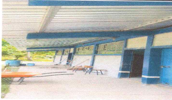
Foto 1: Aquí se muestra la finalización del entechado de cada una de las aulas de la escuela.